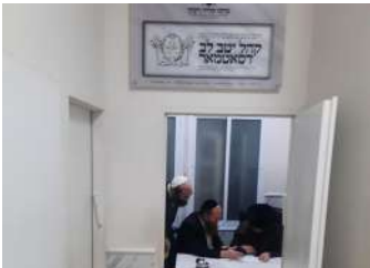
ר' שמעון ביי דער עבודת הקודש אין "מרכז" אפיס

אריינגעגעבן א קלאגע צום בג"ץ אז מ'זאל שוין הייסן די רעגירונג אריינשלעפן אלע חרדים אין מיליטער, אבער די געריכט-דאטומס דערפאר זענען באשטימט געווארן אויף אדר א', גאנץ נאנט צו די צייט ווען די ממשלה'ס צייטווייליגע געזעץ וועט אויסלויפן.