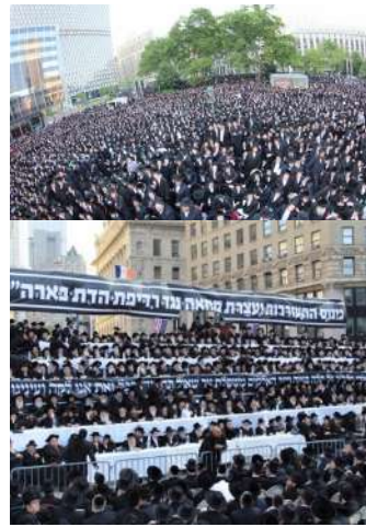
ביים היסטארישן עצרת אין מאנהעטן א' קרח תשע"ג קעגן דעם ביטען גזירת גיוס בני הישיבות, פארופן דורך 'ליק מן אומרי' מסאטמאר שלישיא, און מיט באטייליגונג פון אלע שיכטן און קהילות אין ניו יארק

אלע זייערע מהלכים וואס זיי האבן פרובירט ביז יעצט, ווי נאכאן א 'חוק ערך לימוד התורה', אד"ג זענען דורכגעפאלן. בדרך הטבע איז אוממעגליך צו זען אז זיי זאלן קענען אויסארבעטן א מהלך וואס זאל סיי ווערן אנגענומען אין בג"ץ און סיי ערמעגליכן צו האלטן אלע חרדישע בחורים ארויס פון מיליטער. – נישט קיין צווייטער ווי אריי' דרעי, דער פירער פון ש"ס, האט געזאגט די וואך ביי אן אינטערוויו אז "אין לי פתרון".