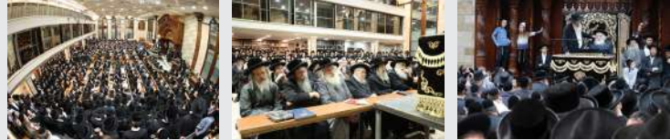
זעט אויסזאן פון דברות קודש אויף זייט 7

טויזנטער בני ציון היקרים, בראשות חברי הבד"ץ וגדולי הרבנים שליט"א, באטייליגן זיך ביי "שבת הגדול" דרשה ליל ששי טהרה אין ביהמ"ד הגדול 'היכל מהרי"ץ דושינסקיא', וועלכע איז שוין לאנגע יארן די תורה'דיגע אכסניא פאר די שבת הגדול דרשה פון די ירושלימ'ער רבנים